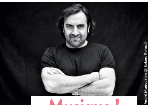
André Manoukian