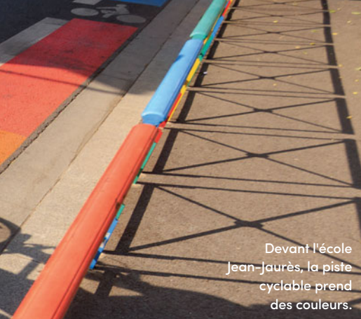
Devant l'école Jean-Jaurès, la piste cyclable prend des couleurs.