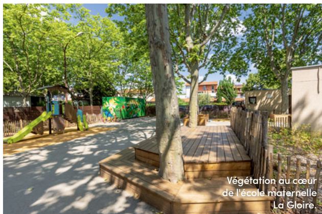
Végétation au cœur de l'école maternelle La Gloire.