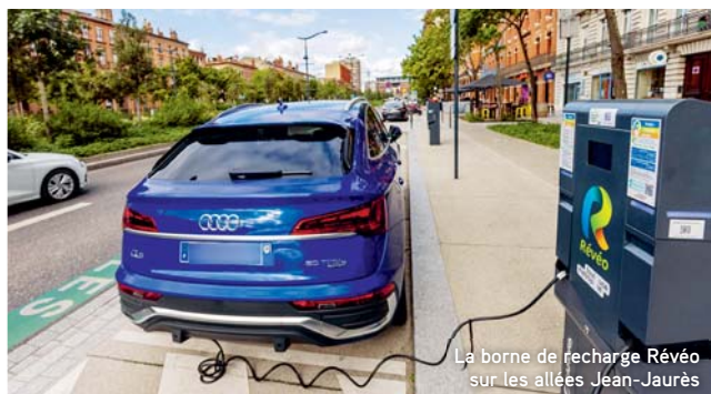
La borne de recharge Révéo sur les allées Jean-Jaurès

Retrouvez toutes les informations sur toulouse-metropole.fr