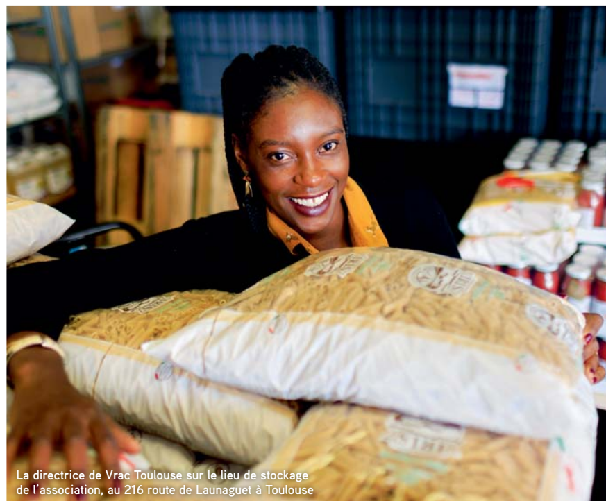
La directrice de Vrac Toulouse sur le lieu de stockage de l'association, au 216 route de Launaguet à Toulouse

La nouvelle offre de Terreauciel, Les Carrés maraîchers, propose aux habitants la location de parcelles chez un maraîcher, au 216 route de Launaguet à Toulouse (site du collectif Edenn). Le professionnel est en charge des travaux principaux (travail du sol, semis et plantations, irrigation, etc.) et gère la planification des cultures. Les habitants peuvent louer une parcelle, participer à l'entretien et récolter les légumes. Une solution accessible pour jardiner, s'alimenter sainement en milieu urbain et recréer du lien entre producteurs et consommateurs.