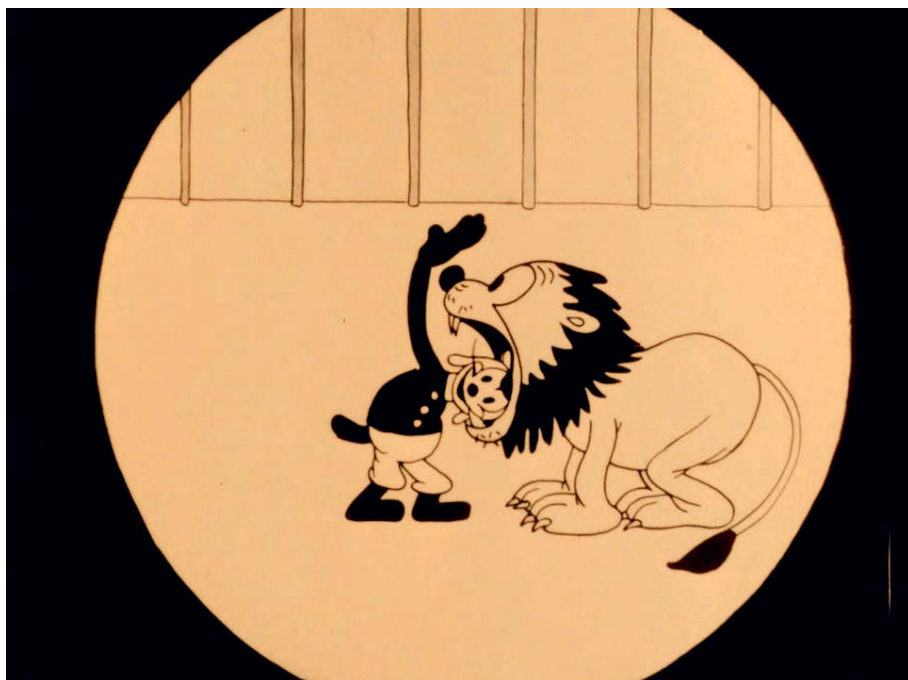
Alice comedies vol 2 La Magie du cirque - Photo 1 | Malavida