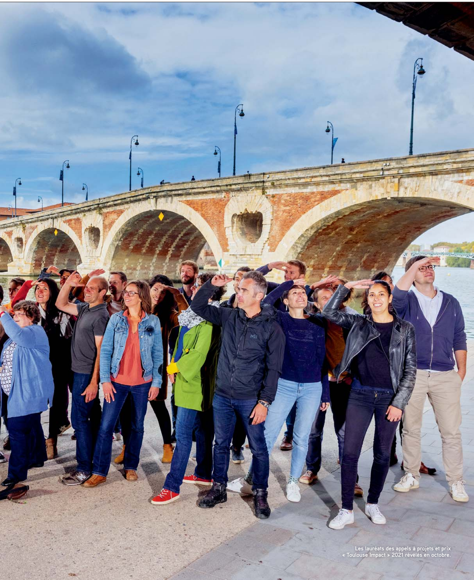
Les lauréats des appels à projets et prix « Toulouse Impact » 2021 révélés en octobre.