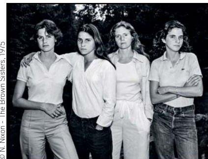
© N. Nixon - The Brown Sisters, 1975