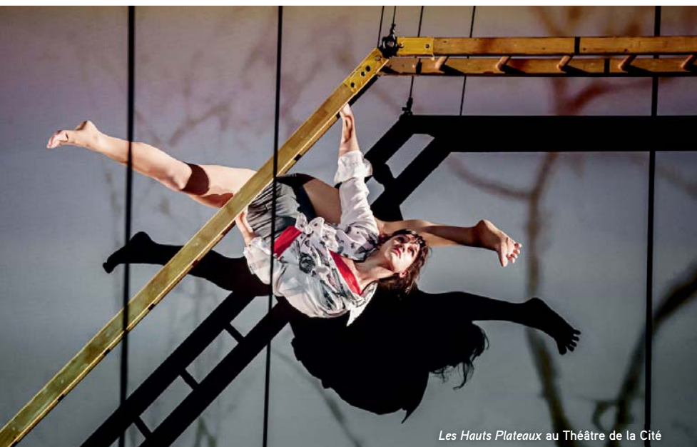
Les Hauts Plateaux au Théâtre de la Cité