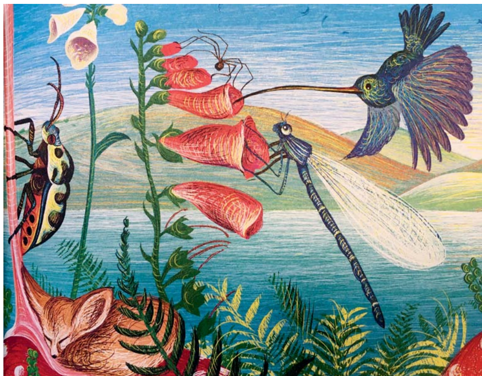
Les illustrations d'Isabelle Simler seront exposées au Pavillon Blanc à Colomiers, à la bibliothèque de Rangueil et à l'Espace Bonnefoy à Toulouse