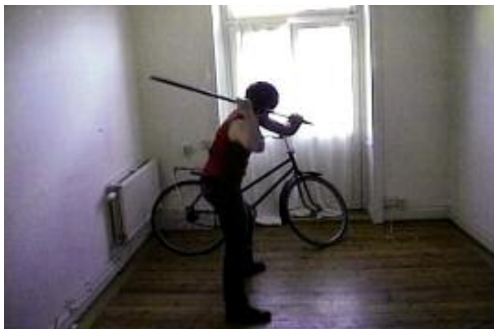
Klara Liden, Bodies of Society , 2006 (still)

Nocturnes les 23-24-30 septembre et 1 er octobre jusqu'à 00h30