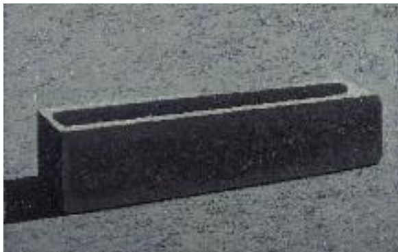
« Sculpture n° 10, huile sur toile (160 x 200) - 2009 »