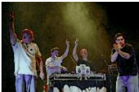
Le groupe MP1.2, vainqueur de l'édition 2011

Début de soirée au Chapeau Rouge pour la sélection du jour et deuxième partie sur la péniche Le Cri de la Mouette.