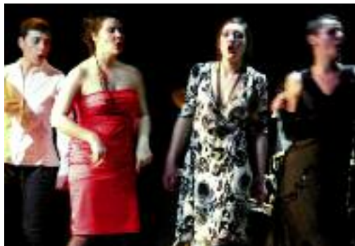
Cie la Machine à Rêve - Théâtres d'Hivers 2010

Et par leur statut d'amateurs, ils défendent une idée simple et de bon sens : l'expérience et la jubilation collective de la création n'est pas un domaine réservé aux seuls professionnels. Chacun peut la partager, sur des textes du répertoire classique ou contemporain.