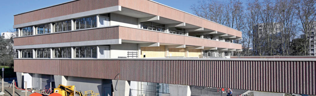
Groupe scolaire Marie Marvingt.