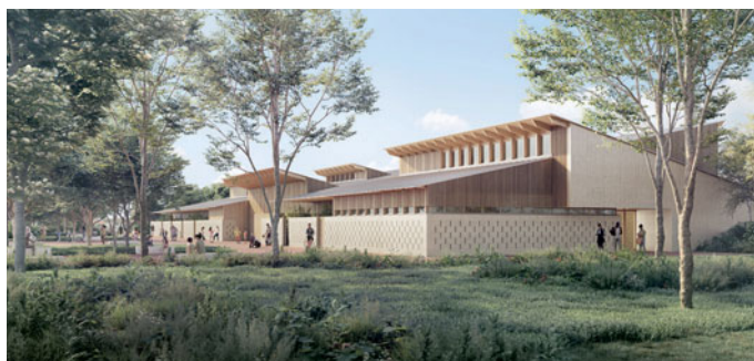
Vue du stade Rigal.

Après l'amélioration de l'offre commerciale et de services sur les places Micoulaud et Ahmed-Chenane, le quartier des Trois-Cocus poursuit sa transformation avec de nombreuses actions en faveur de sa végétalisation. Le parc des Faons, à proximité de la place éponyme, s'étoffera avec 400 arbres supplémentaires d'ici 2027. À quelques encablures, le parc Rigal (3 ha) accueillera de nouveaux arbres, des agrès sportifs dédiés à tous les âges, des fontaines à eau ainsi qu'un théâtre de verdure et des terrains de pétanque ombragés. L'ensemble sera maillé par