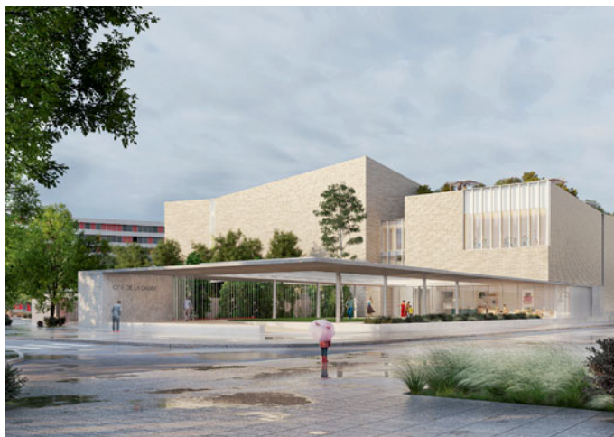
La future Cité de la danse.

Dans ce quartier, la transformation urbaine, dont le programme court jusqu'en 2030, avance sur plusieurs fronts, avec une priorité au logement. En plus des rénovations qui concernent deux tiers des opérations, 862 logements sociaux sont en passe d'être démolis et 1 206 seront construits sur place, dont 50 % de logements privés afin d'amener de la mixité dans le quartier, qui compte aujourd'hui 85 % de logements sociaux. Place Abbal, la dalle sera bientôt détruite pour embellir l'espace, le verdier, l'ouvrir sur le lac et accueillir la future Cité de la danse. Un nouveau pôle commercial sortira de terre à partir de cet été. L'ouverture d'une Maison de santé, à l'automne prochain, facilitera l'accès