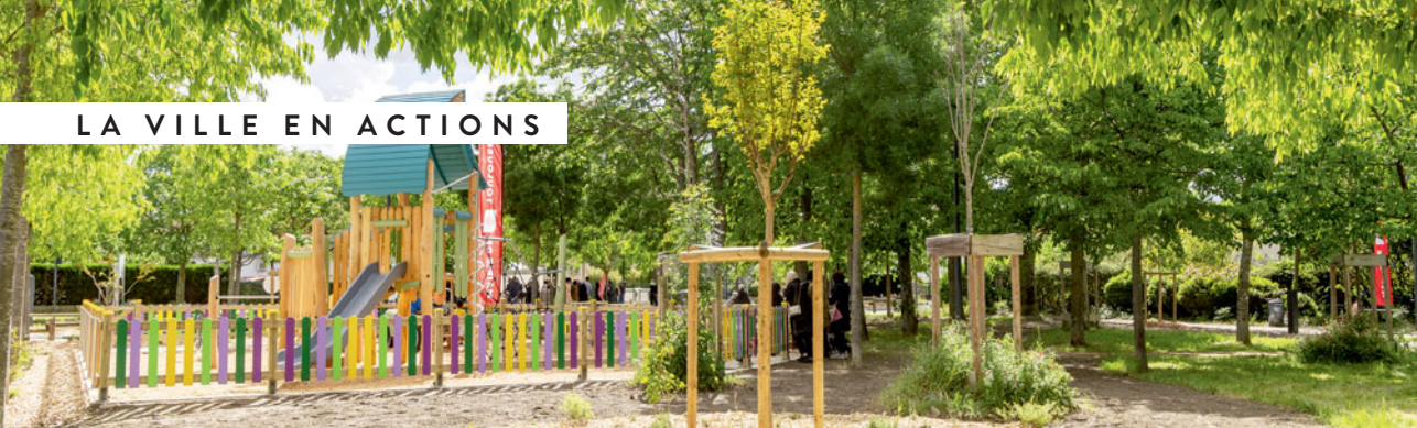
Square Vendôme, le Milan.