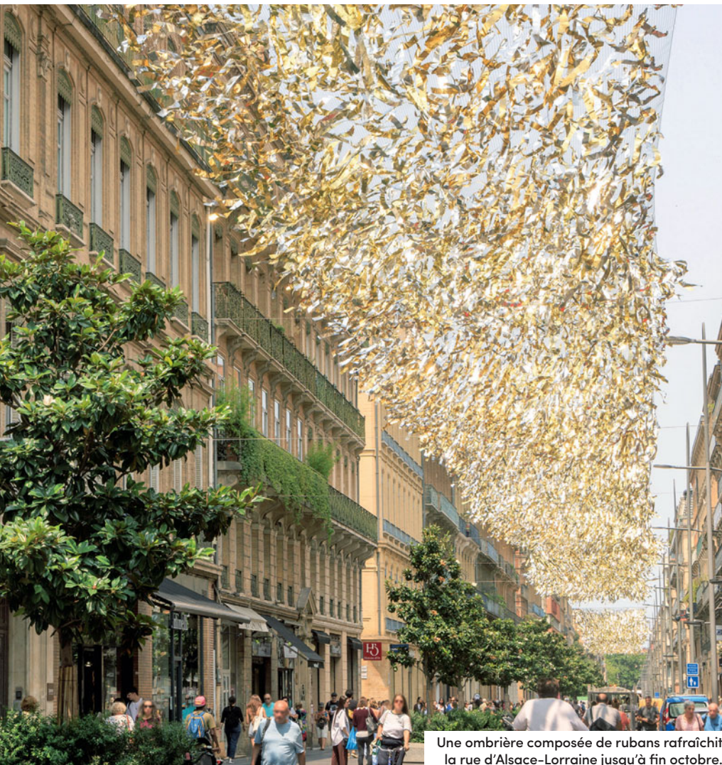
Une ombrière composée de rubans rafraîchit la rue d'Alsace-Lorraine jusqu'à fin octobre.

jardinières, près d'une trentaine d'arbres de 3,50 à 6 mètres de haut a été disposée de part et d'autre de la place, côté Séphora et côté Bibent. Le choix des jardinières et leur emplacement ont été validés par l'Architecte des Bâtiments de France et les essences sélectionnées pour leur capacité à s'adapter aux évolutions du climat. Ces mesures s'inscrivent dans un plan plus large, Toulouse + fraîche, qui décline une trentaine d'actions pour faire face au réchauffement climatique : déployer la nature en ville, préserver les ressources en eau, proposer des îlots de fraîcheur et des jeux d'eau pendant l'été, ombrager les espaces les plus chauds, protéger les personnes vulnérables telles que les enfants et les seniors... + d'infos sur metropole.toulouse.fr